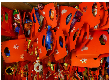
die kleinen roten Tüten

Da die Bewohner*innen der Heime nicht besucht werden konnte, gab es die Bitte um Grußkarten zum Weihnachtsfest. Und es kamen 150 Karten!!!! Berührend, witzig, bunt.