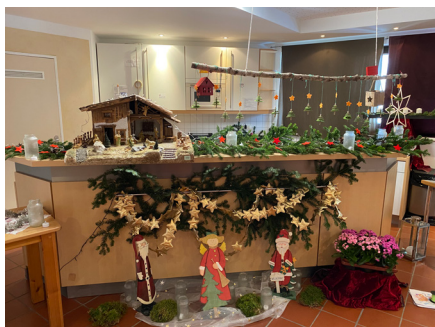
Adventsmarkt im ÖZ-Cafe

Kein Krippenspiel, kein Gottesdienst für Kinder?