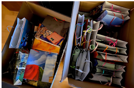
die großen Tüten

Aber vier fleißige Hände. Ein Paar Hände haben große Tüten geschnitten und geklebt und ein Paar Hände haben die kleinen, roten Tüten geschnitten und geklebt. Und dann wurden beide Tütenvarianten befüllt. Weihnachtsbotschaft zum Anschauen und zum süßen Schleckchen.