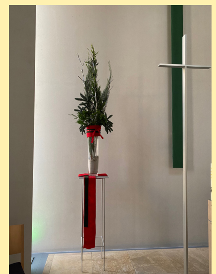
Adventsgesteck Kirche Maria Magdalena

... hat die Aufgabe der Gemeindeentwicklung, vor allem durch Personal- und Gottesdienst- sowie Kooperationsentscheidungen. Die Kirchenvorsteher*innen fördern das Vertrautwerden mit dem christlichen Glauben, tragen Verantwortung für die Kontaktgestaltung zu allen Gemeindegliedern, entscheiden, wie die evangelische Lehre vor Ort mit Leben gefüllt wird, kümmern sich um die Gewinnung und Motivation ehrenamtlicher Mitarbeiter*innen, stärken die Einheit der Gemeinde und arbeiten bei Konflikten auf Lösungen hin. Der KV hat Verantwortung für die Gebäude der Kirchengemeinde und verwaltet das Vermögen der Gemeinde. Der KV trifft sich monatlich. Pfr/ Pfrin gehört durch sein/ihr Amt mit zum KV und hat, ebenso wie jedes KV Mitglied, bei Abstimmungen eine Stimme.