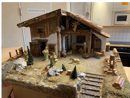
Krippe im ÖZ

An diesen Satz haben wir uns im Corona-Jahr 2020 gewöhnt. Alles anders! Keinen Urlaub, auf Abstand leben, Kontakte meiden, nicht Essen gehen, Schule online, und dann – am Ende – Corona-Weihnachten und Silvester ohne Böller. Alles anders im Jahr 2020! Wird in diesem Jahr alles wieder wie das Alte? So, wie es vorher war? Wollen wir das überhaupt? Mich hat begeistert, fasziniert und gerührt, was in der Gemeinde geschah – im Advent und Weihnachten letzten Jahres: Kein großer Bazar möglich. Gut, dann baut die Kita eben einen kleinen Adventsmarkt auf im ÖZ-Cafe. Wunderschön und mit großem Erfolg.