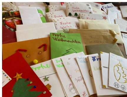
Weihnachtsbotschaft in Tüten

Da die Bewohner*innen der Heime nicht besucht werden konnte, gab es die Bitte um Grußkarten zum Weihnachtsfest. Und es kamen 150 Karten!!!! Berührend, witzig, bunt.