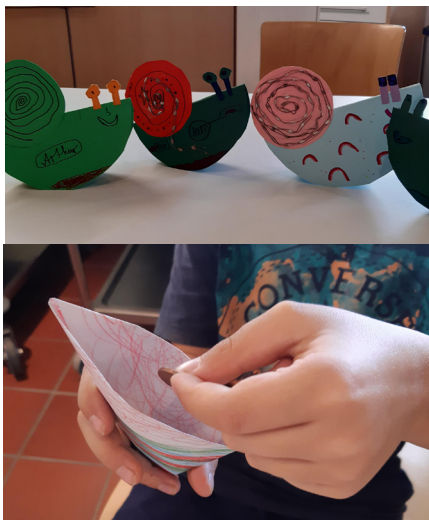
Schneckenparade und Zauberbecher

Unter Anleitung von Frau Kröker treffen sich Kinder im Alter zwischen 6 und 10