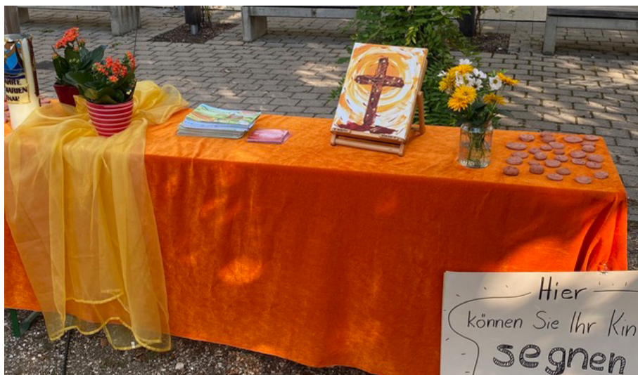
Segentisch im Pausenhof

Da die Erstklässler aufgrund der Coronavorgaben nicht in die Kirche durften, kam die Kirche am Einschulungstag in den Pausenhof. Kinder und Eltern ließen sich segnen von Pfr. Geyer und Pfrin. Heider.