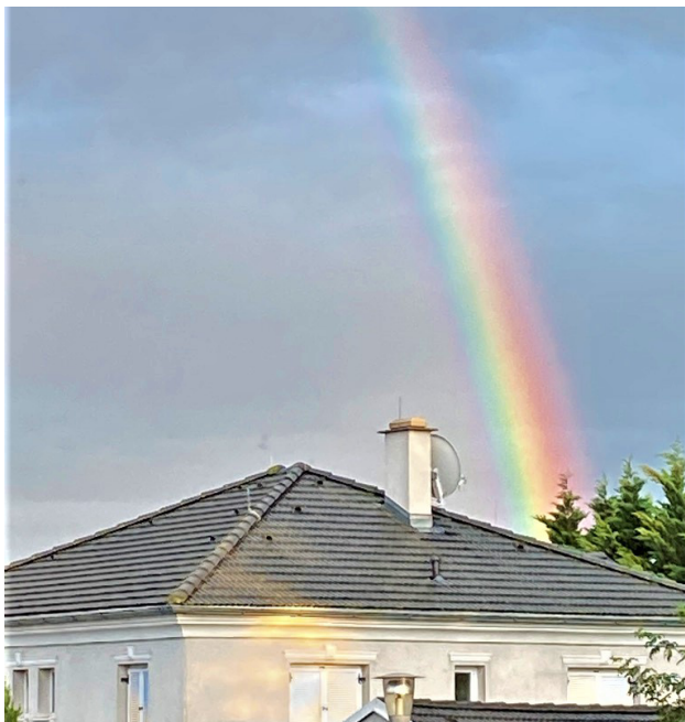
Gottes Bogen steht

Letztes Jahr im November, da standen hier im Andachtsteil die Fotos der Konfirmandinnen. Wegen Corona musste damals ja alles verschoben werden.